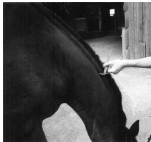
Abb 1 Messung der Kammfettdicke am Hals bei gesenkter Kopfhaltung: Die Halsmuskulatur stellt die untere Begrenzung für die Messung dar, die Dorsalseite des Mähnenkamms die obere. Measurement of crest fat thickness in the neck: Head must be lowered, that the neck muscles become visible as lower borderline of crest fat.