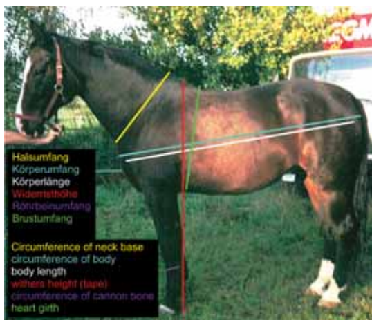
Abb 2 Darstellung der biometrischen Messungen. Biometric measurements

Die wesentlichen Kriterien zur Beurteilung des Ernährungszustandes sind in Tabelle 2 zusammen gefasst. Hals: Am Hals ist das Kammfett zur Beurteilung des Ernährungszustandes hervorragend geeignet. Bei einem BCS von 3 und niedriger ist kein Kammfett vorhanden, bei höheren BCS nimmt die Höhe des Kammfettes nahezu linear zu, sie kann bei fett-süchtigen Pferden 10 cm und mehr erreichen. Eine Einziehung vor dem Widerrist, ein sogenannter Axthieb ist bis zu einem BCS von 4 und niedriger vorhanden bzw. angedeutet, normalgewichtige und dicke Pferde weisen dagegen selten einen Axthieb auf. Ausserdem wird beurteilt, ob die Seitfläche des Halses konkav oder konvex ist. Schulter: Im Bereich der Schulter und des vorderen Brustkorbs sind einmal die Sichtbarkeit der Scapula und der Rippen sowie die Möglichkeit zur Bildung einer Falte durch Hochziehen von Haut und subcutanem Fettgewebe über dem Trizeps femoris wesentliche Kriterien. Während bei unterernährten Pferden eine Faltenbildung an dieser Stelle nicht möglich ist, kann bei verfet-